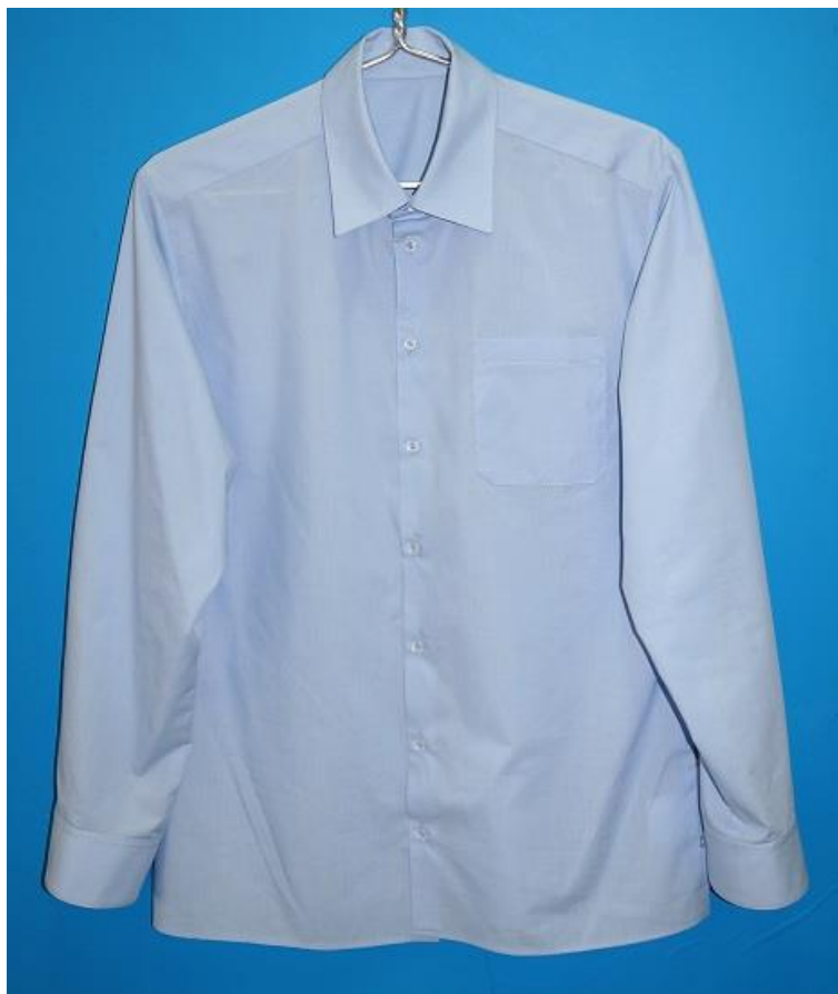
Фото № 1 «Рубашка для юношей»